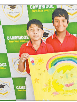
झज्जर। पोस्टर दिखाते प्रतियोगिता के प्रतिभागी।

काफी अधिक रहते हुए एक लाख 36 हजार 962 क्विंटल तक पहुंच गया है। सरकारी खरीद की बात करें तो बहादुरगढ़ मंडी में 16 हजार 44 क्विंटल गेहूं खरीदा जा चुका है। दूसरी ओर आसौदा मंडी में अब तक उठान तेज गति से जारी है, वहीं आसौदा मंडी में आवक घटने के बावजूद उठान अभी पीछे चल रहा है। वीरवार को बहादुरगढ़ मंडी में उठान तेज गति से जारी है, वहीं आसौदा मंडी में आवक घटने के बावजूद उठान अभी पीछे चल रहा है। वीरवार को बहादुरगढ़ मंडी में उठान तेज गति से जारी है, वहीं आसौदा मंडी में आवक घटने के बावजूद उठान अभी पीछे चल रहा है। वीरवार को बहादुरगढ़ मंडी में उठान तेज गति से जारी है, वहीं आसौदा मंडी में आवक घटने के बावजूद उठान अभी पीछे चल रहा है।