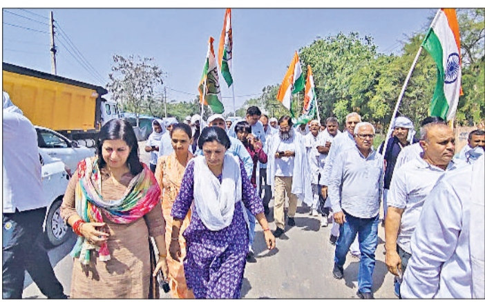
झज्जर। सद्भावना यात्रा में शामिल कार्यकर्ता और पूर्व सांसद बृजेन्द्र सिंह।

पूर्व सांसद बृजेन्द्र सिंह की सद्भावना यात्रा वीरवार को झज्जर विधानसभा क्षेत्र में प्रवेश कर गई। यात्रा की शुरुआत ग्वालिसन गांव से हुई। इसके बाद यह यात्रा तलाव गांव, भगत सिंह चौक, छिक्कारा चौक, आंबेडकर चौक, राव तुलाराम चौक होते हुए बार एसोसिएशन कार्यालय में पहुंची और उन्होंने वकीलों से मुलाकात की। इससे पूर्व उन्होंने महापुरुषों की प्रतिमाओं पर पुष्प अर्पित कर नमन किया। कार्यकर्ताओं ने यहां उनका जोरदार स्वागत किया। लेकिन खास बात यह देखने को मिली कि कांग्रेस जिलाध्यक्ष सहित बेरी, झज्जर और बादली विधानसभा के तीनों विधायकों ने यात्रा से दूरी बनाए रखी। यह तीनों विधायक पूर्व मुख्यमंत्री भूपेंद्र सिंह हुड्डा गुट से माने जाते हैं। गौरतलब है कि सद्भावना यात्रा में पूर्व सीएम हुड्डा भी एक बार भी शामिल नहीं हुए हैं। इस दौरान पत्रकारों से रूबरू होते हुए