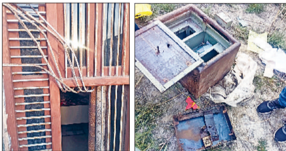
झंझार। चोरों द्वारा तोड़ा गया मकान का जंगला व खाली की गई तिजोरी।

■ सोने व चांदी के जेवर, चांदी के सिक्के व एक लाख रुपये चोरी