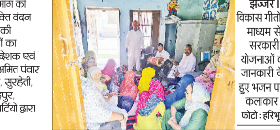
झज्जर। विकास गीतों के माध्यम से सरकारी योजनाओं की जानकारी देते हुए भजन पार्टी कलाकार।