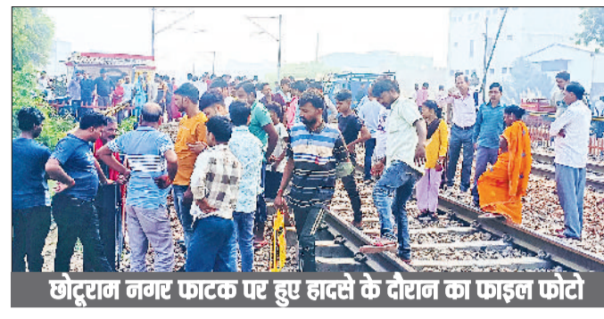
छोटाराम नगर फाटक पर हुए हादसों के दौरान का फाइनल फोटो

चुकी है। टिकरी बॉर्डर से छोटाराम नगर फाटक तक का एरिया सबसे ज्यादा संवेदनशील माना जा रहा है। जीआरपी ने रेलवे लाइन पर आमजन की सीधी एंटी रोकने के लिए रेलवे को पत्र भी लिखा है, लेकिन अभी तक जमीनी स्तर पर ठोस कार्रवाई नजर नहीं आई है। दरअसल, रेलवे लाइन के एक तरफ घनी आबादी वाला छोटाराम नगर है, जहां हजारों प्रवासी रहते हैं। जबकि दूसरी ओर औद्योगिक क्षेत्र में बड़ी संख्या में फैक्ट्रियां हैं। आने-जाने के