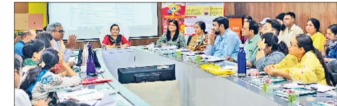
झंझार। बैठक में उपस्थित अधिकारियों को दिशा-निर्देश देते हुए सीएमओ।

यह स्थिति गंभीर रूप ले सकती है। बैठक के दौरान उन्होंने बताया कि लू के प्रमुख लक्षणों में तेज बुखार, चक्कर आना, उल्टी, सिरदर्द, अत्यधिक कमजोरी, त्वचा का सुखना एवं बेहोशी शामिल हैं। उन्होंने कहा कि आमजन को इन लक्षणों