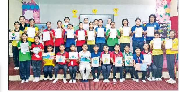
झज्जर। शिक्षकों के साथ मंच पर उपस्थित पेंटिंग प्रतियोगिता के प्रतिभागी।