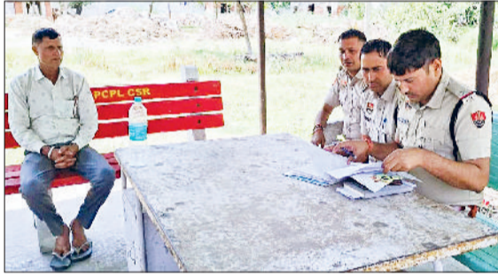
झंझार। नागरिक अस्पताल परिसर में पोस्टमार्टम के लिए कामगो की कार्यवाई करते हुए पुलिसकर्मी।

क्षेत्र के गांव बहू की सीमा में लगते खेतों में एक युवक की उसके ही साथियों ने गोली मारकर हत्या करने की वारदात को अंजाम दिया है। सूचना मिलने के बाद पुलिस ने मौके पर पहुंचकर परिजनों से मामले की जानकारी ली, एफएसएल टीम ने भी मौके