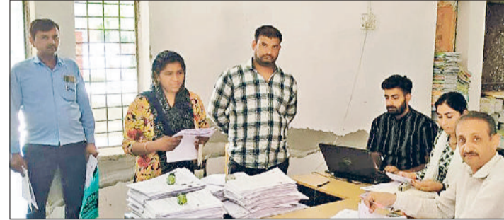
बहादुरगढ़। बीईओ कार्यालय में दस्तावेजों का सत्यापन करते कमेट्री सदस्य।