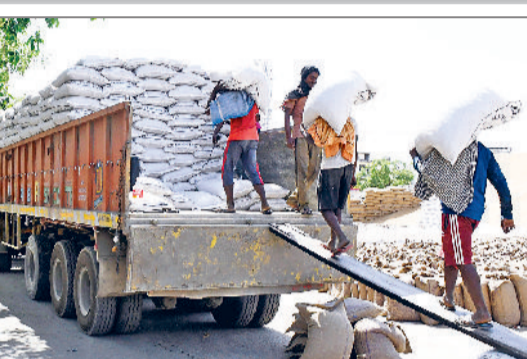
झज्जर। अनाज मंडी में उठान कार्यों में जुटे श्रमिक।

जिले की अनाज मंडियों में गेहूं की आवक और खरीद निरंतर जारी है। वीरवार को स्थानीय अनाज मंडी में केवल उठान का कार्य ही किया गया। विभागीय आंकड़ों के अनुसार स्थानीय अनाज मंडी में अभी तक 6 लाख 38 हजार क्विंटल गेहूं की आवक दर्ज की गई है, जबकि 4 लाख 5 हजार क्विंटल गेहूं की खरीद की जा चुकी है। इसके अलावा 2 लाख 57 हजार क्विंटल गेहूं यानी करीब 63 प्रतिशत का उठान हो चुका है।