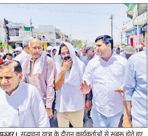
झज्जर। सद्भावना यात्रा के दौरान कार्यकर्ताओं से रूबरू होते हुए पूर्व सांसद बृजेन्द्र सिंह।

पूर्व सांसद बृजेन्द्र सिंह ने भाजपा पर समाज में जहर घोलने का आरोप लगाया। उन्होंने कहा कि भाजपा समाज में जहर घोलकर अपनी राजनीति साधने का काम कर रही है। कांग्रेस व उनकी इस सद्भावना यात्रा का मकसद इसी राजनीति का मुकाबला करना है। उन्होंने अपनी यात्रा को तप बताते हुए कहा कि समाज को जोड़ने के लिए किया गया यह प्रयास किसी भी तरह से गलत नहीं है। यात्रा में कांग्रेस के बड़े नेताओं की गैर मौजूदगी को लेकर पूछे गए सवाल पर उन्होंने